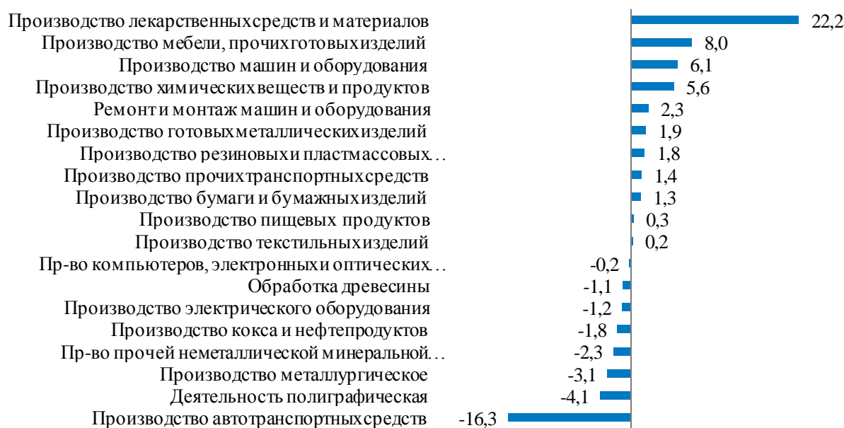
Рис. 3. Прирост валовой добавленной стоимости в обрабатывающих производствах России в 2020 г., % к предыдущему году