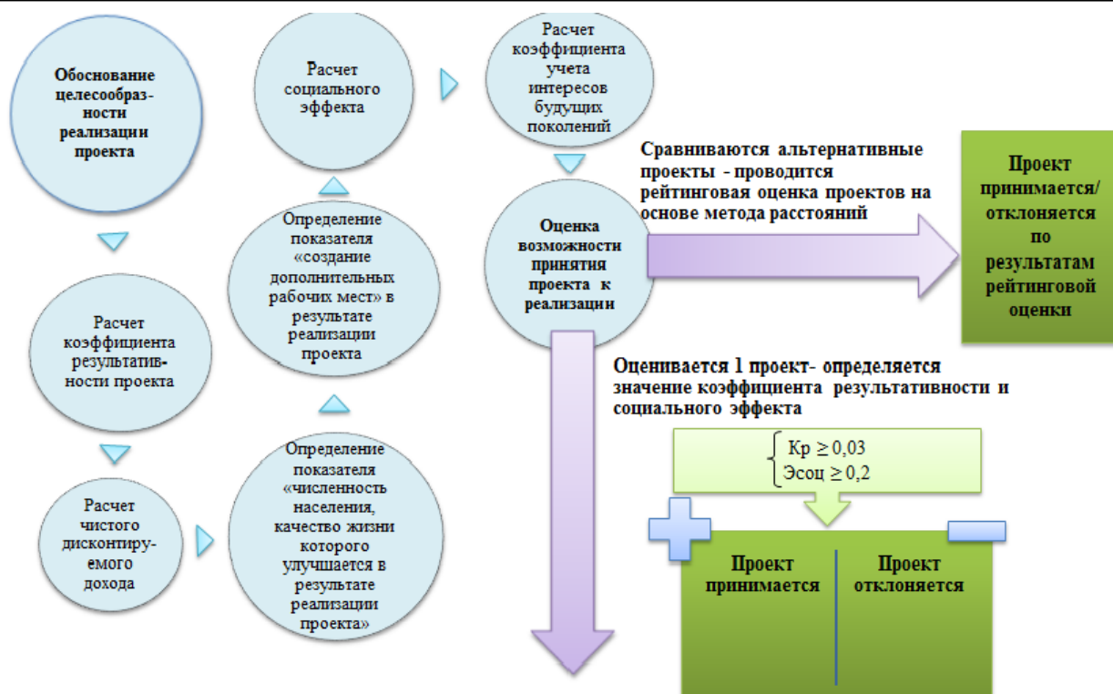
Рис.3. Алгоритм оценки эффективности социальных проектов, реализуемых бизнесом в рамках КСО

Коэффициент по соответствующей методике (получен экспертным путем) составляет 0,1.