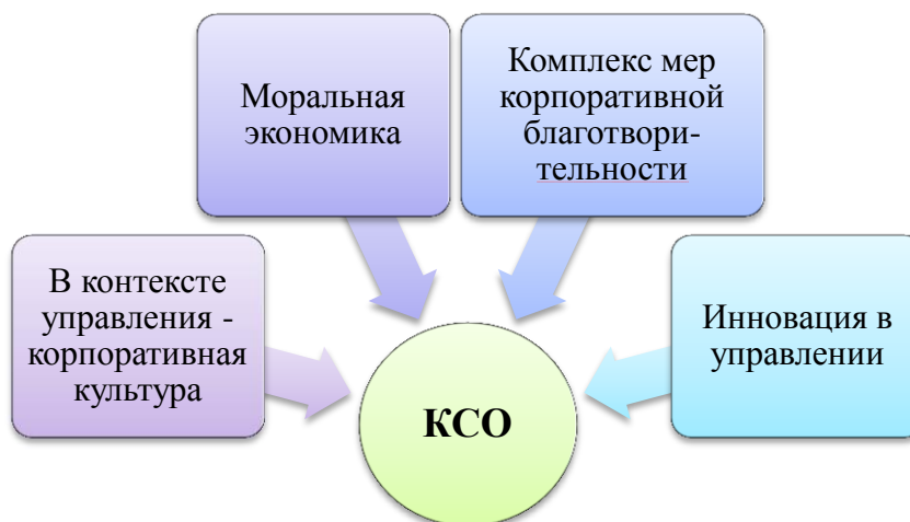
Рис.1. Концепции социально ответственного бизнеса

ной ответственности по международным стандартам (с планированием и отчетностью) и только 5% компаний ориентируются, в первую очередь, на реализацию социальных изменений и социальные инновации.